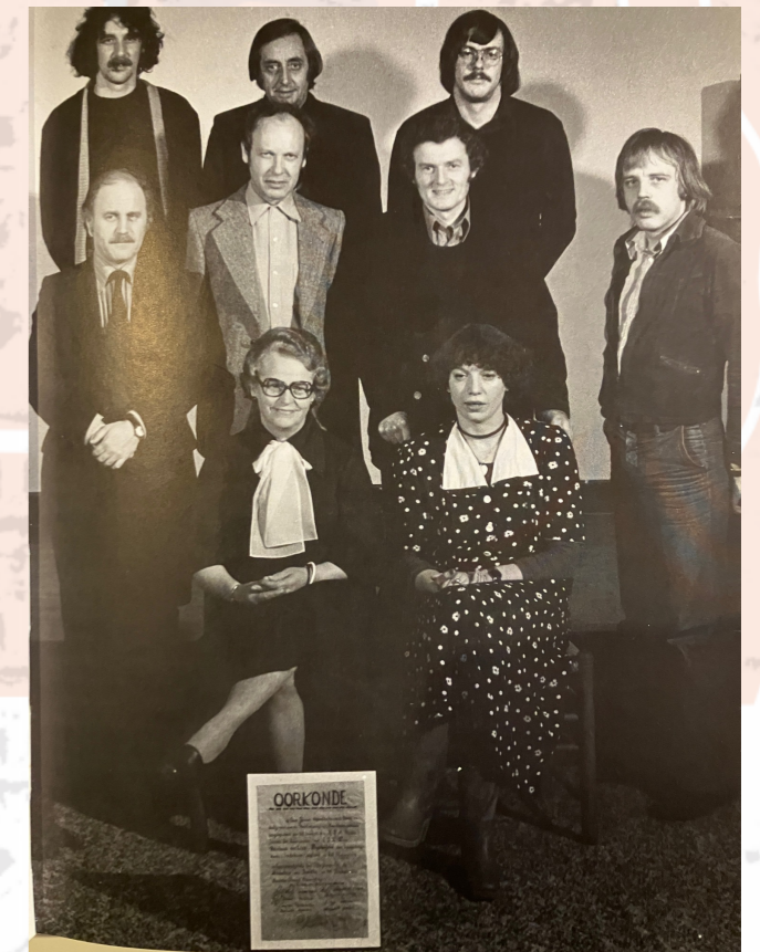
Bestuur van het eerste uur

Buurtfeest – start 50 ste jubileum jaar Zondag 15 september 16.00 – 20.00 in de Fermerie/Muggeplein